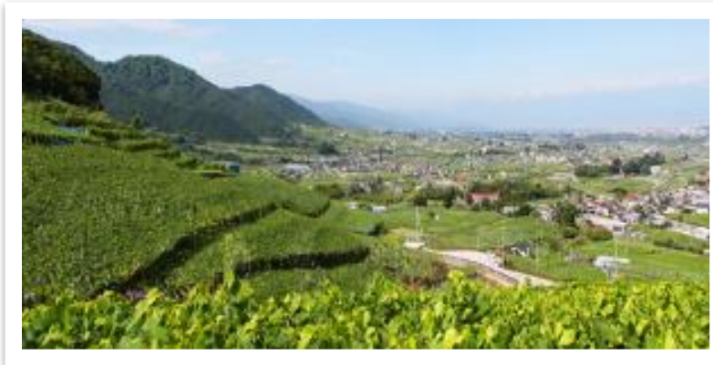
勝沼地域のぶどう畑