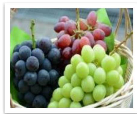
市内で収穫されたぶどう